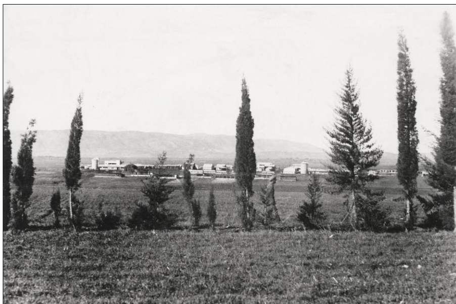
רמת-דוד, מבט מכיוון מזרח, 1938